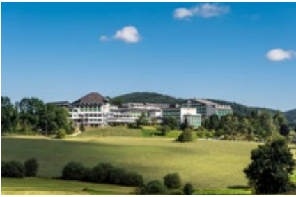
Moorheilbad Harbach moorheilbad-harbach.at