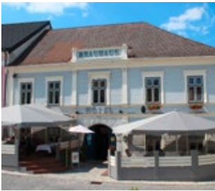
Brauhotel Weitra brauhotel.at