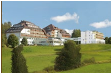
Herz-Kreislauf-Zentrum Groß Gerungs herz-kreislauf.at