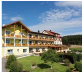
Gasthof Pension Nordwald gasthof-nordwald.at