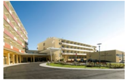
Lebens.Resort Ottenschlag lebensresort.at