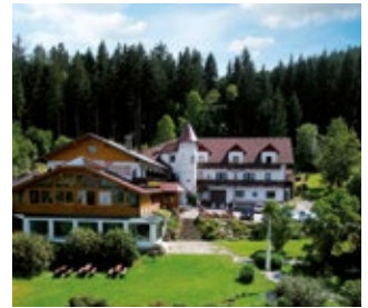
Waldpension Nebelstein waldpension-nebelstein.at