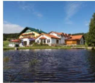
Cafe-Pension Kristall cafe-pension-kristall.at