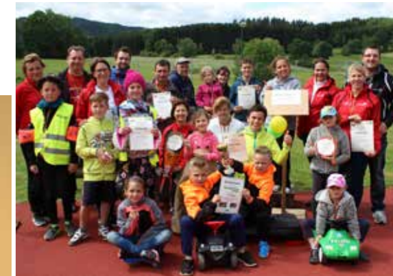
Bei der Familienolympiade 2017 im Moorheilbad Harbach traten 7 Familien gegeneinander an.

Als Gesundheitsbetriebe ist dem Moorheilbad Harbach und dem Lebens.Resort Ottenschlag die Gesundheit der eigenen Mitarbeiter ein besonders großes Anliegen. In Arbeitskreisen werden immer wieder Maßnahmen gesetzt, mit dem Ziel, Krankheiten am Arbeitsplatz vorzubeugen, das