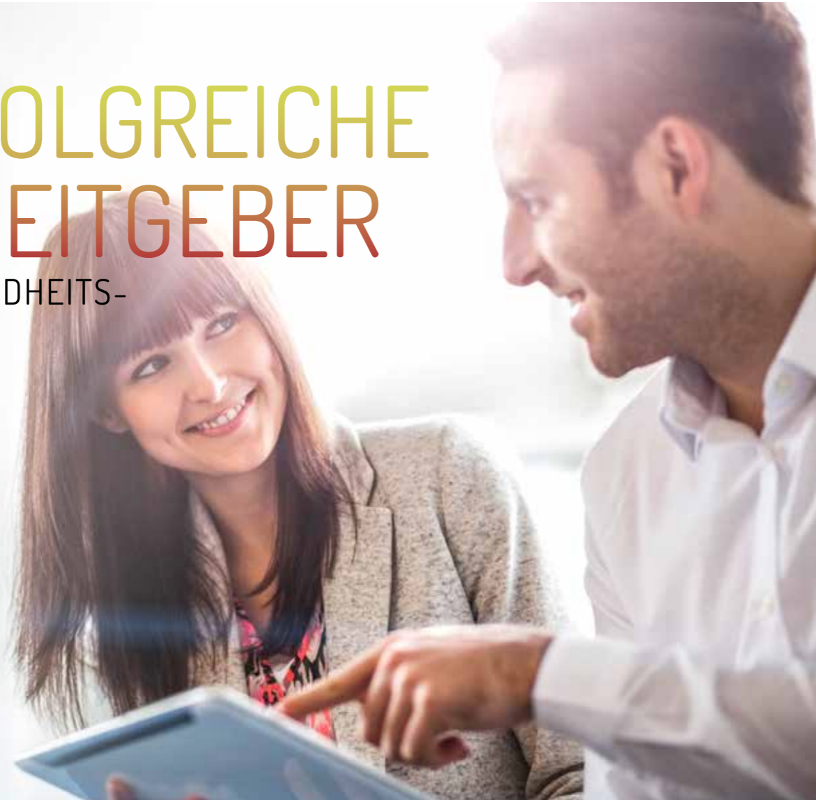
Schulungen: Live-Coaching für Rezeptionsmitarbeiter

DAS MOORHEILBAD HARBACH UND DAS LEBENS.RESORT OTTENSCHLAG BIETEN IHREN MITARBEITERN EIN ABWECHSLUNGSREICHES UND ATTRAKTIVES ARBEITSUMFELD.