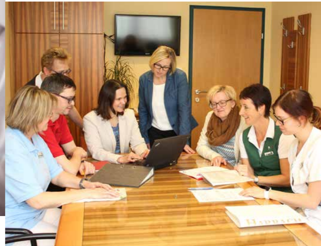
Die Arbeitskreise treffen sich 2 x jährlich zu den Themen Betriebliche Gesundheitsförderung und Frauen- und Familienfreundlichkeit.

Das eigens entwickelte Lehrlingsschulungsprogramm vertieft dabei nicht nur das fachliche Wissen der Lehrlinge, sondern fördert auch deren Eigenverantwortung und persönliche Entwicklung.